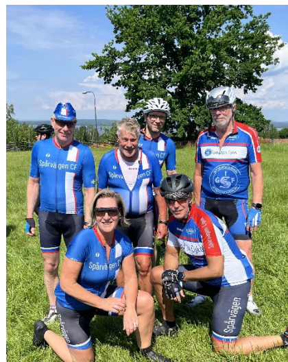
I Tällbergsdalen, Siljan Runt

Även denna helg bjöd på vackert cykelväder i behaglig temperatur.