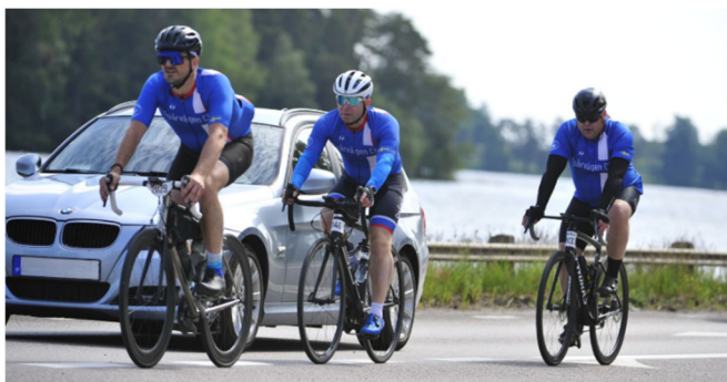
Spåret på omkörning efter Karlsborg, Vätternrundan 315 km

I gryningen, kl. 04.18 den 14 juni cyklade 15 Spårvägare ut ur startfällan i Motala för att starta sin resa runt Vättern. I år blev det ingen sub-satsning utan det var en stor motionsgrupp som var anmäld för Spårvägen. Deltagarna delade in sig i flera mindre grupper beroende på tidsmål och dagsform, och genomförandet tycks ha gått strålande.