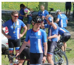
Spårvägare i mål, Trostrampen

Trostrampen i maj bjöd på strålade väder när 10 deltagare från Spårvägen CF gav sig ut på 90 km i Trosabygden.